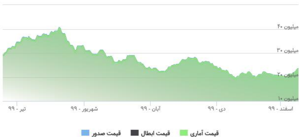
قیمت صدور، ابطال و ارزش آماری هر واحد سرمایه گذاری